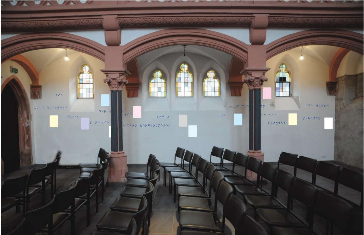
die unbeleuchtete Seite der Worte, sind sie wie schon verglommenees Licht?