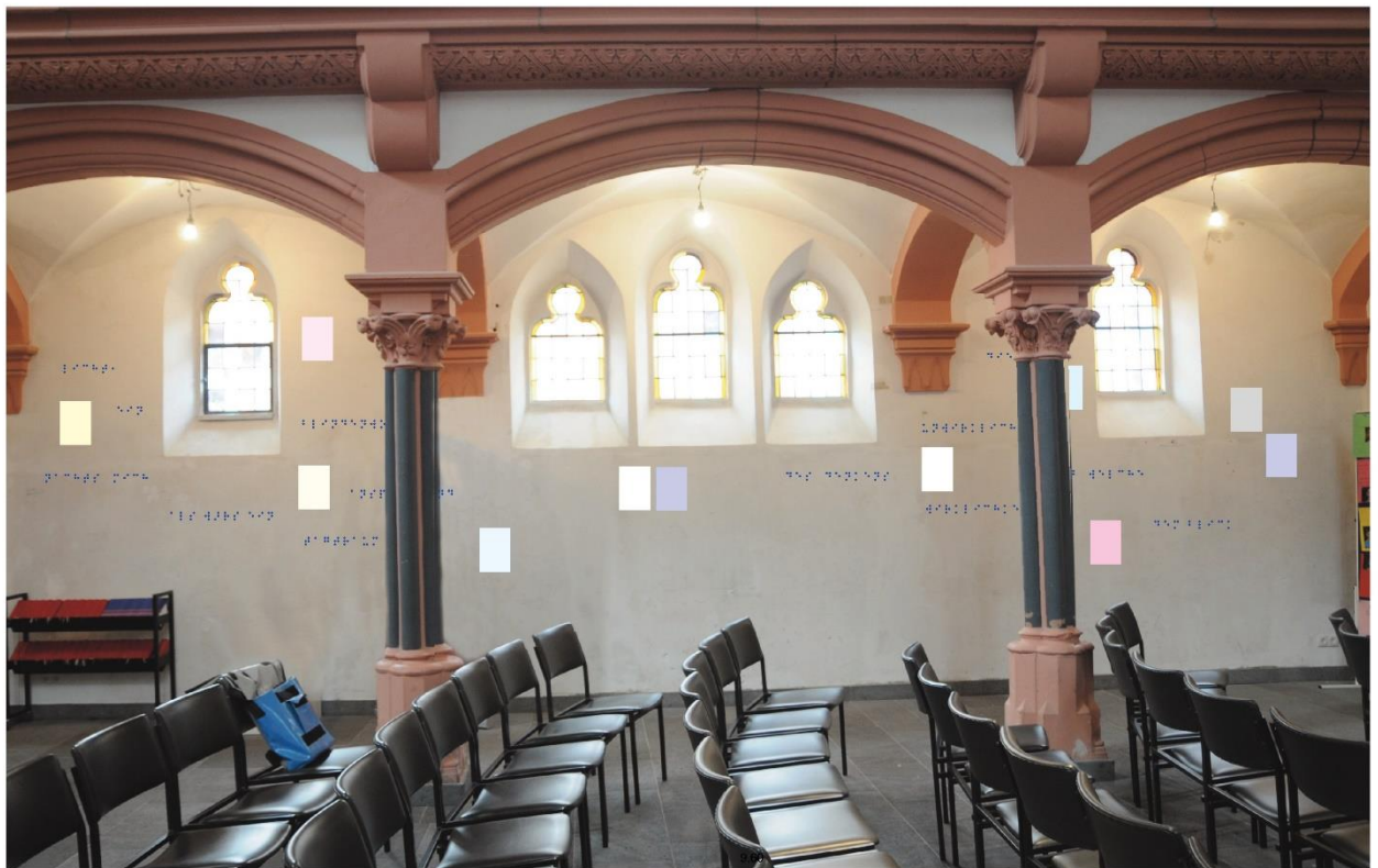
licht, ein blindenwort, nachts mich anspringend als wärs ein tagtraum

Die unbeleuchtete Seite der Worte Ostseite